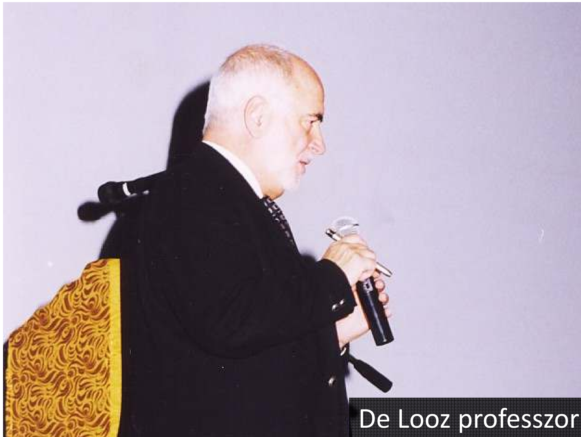
De Looz professor