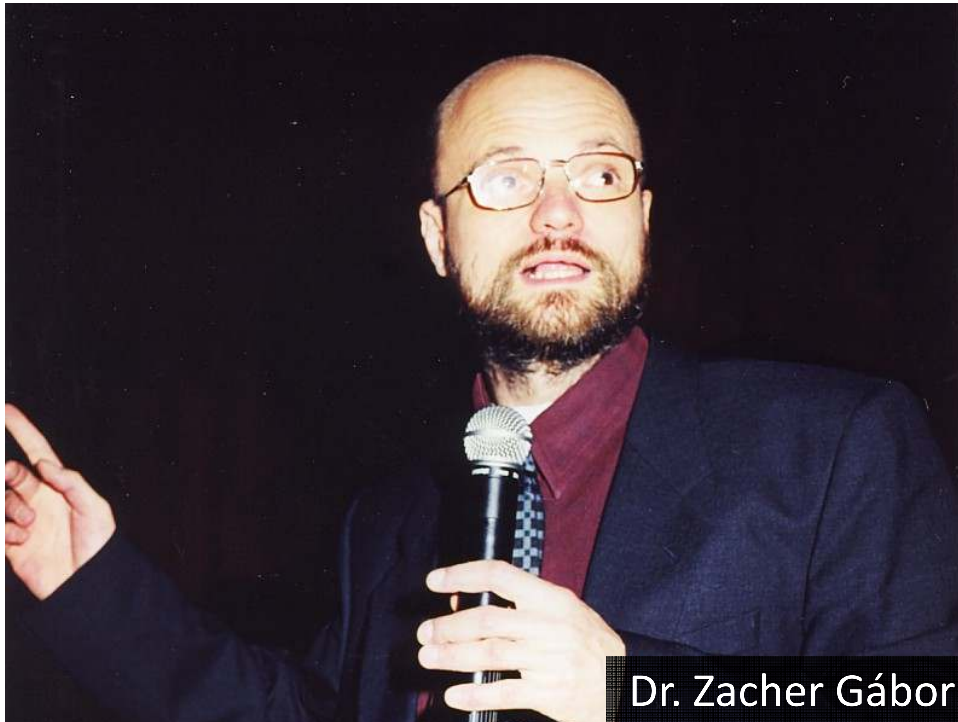
Dr. Zacher Gábor