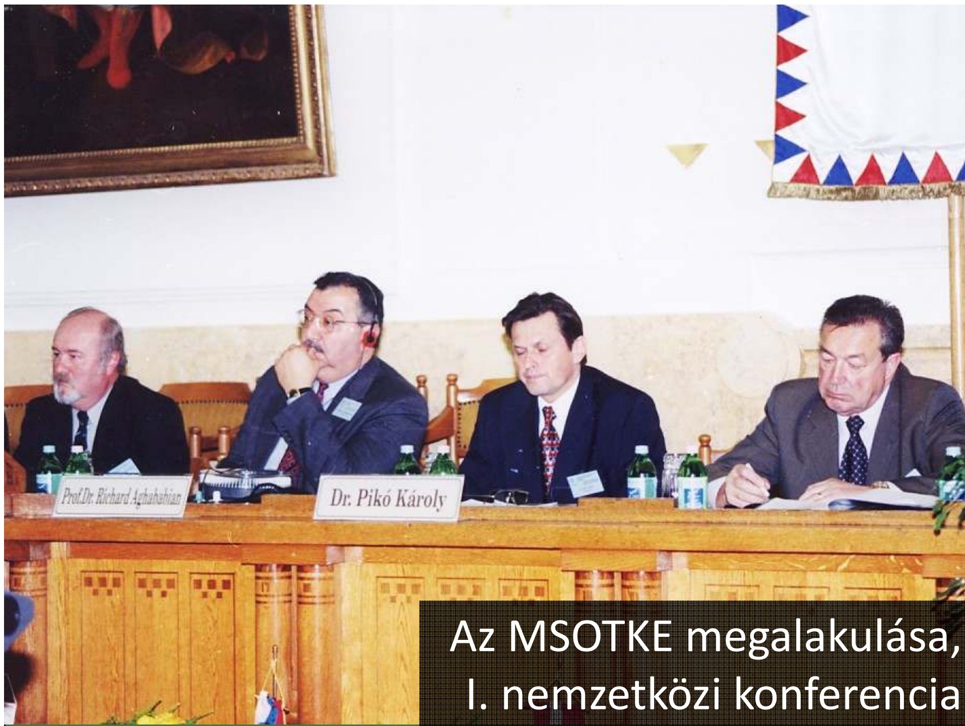
Az MSOTKE megalakulása, I. nemzetközi konferencia