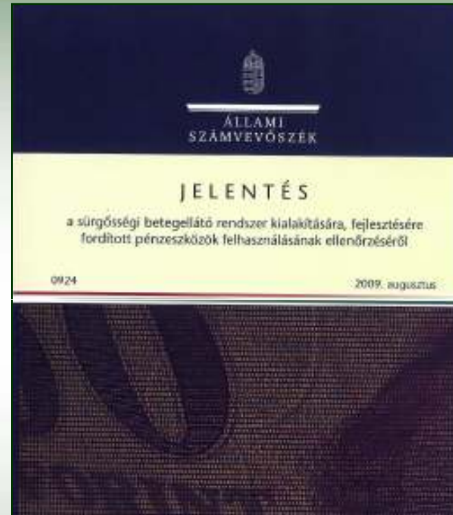
ÁSZ jelentés a sürgősségi betegellátó rendszer kialakítására, fejlesztésére fordított pénzeszközök felhasználásának ellenőrzéséről (2009)