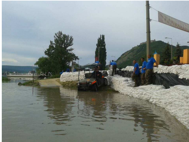
10-12 évente komoly árvíz