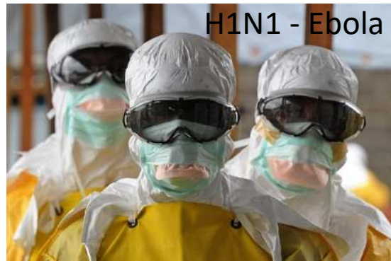
H1N1 - Ebola