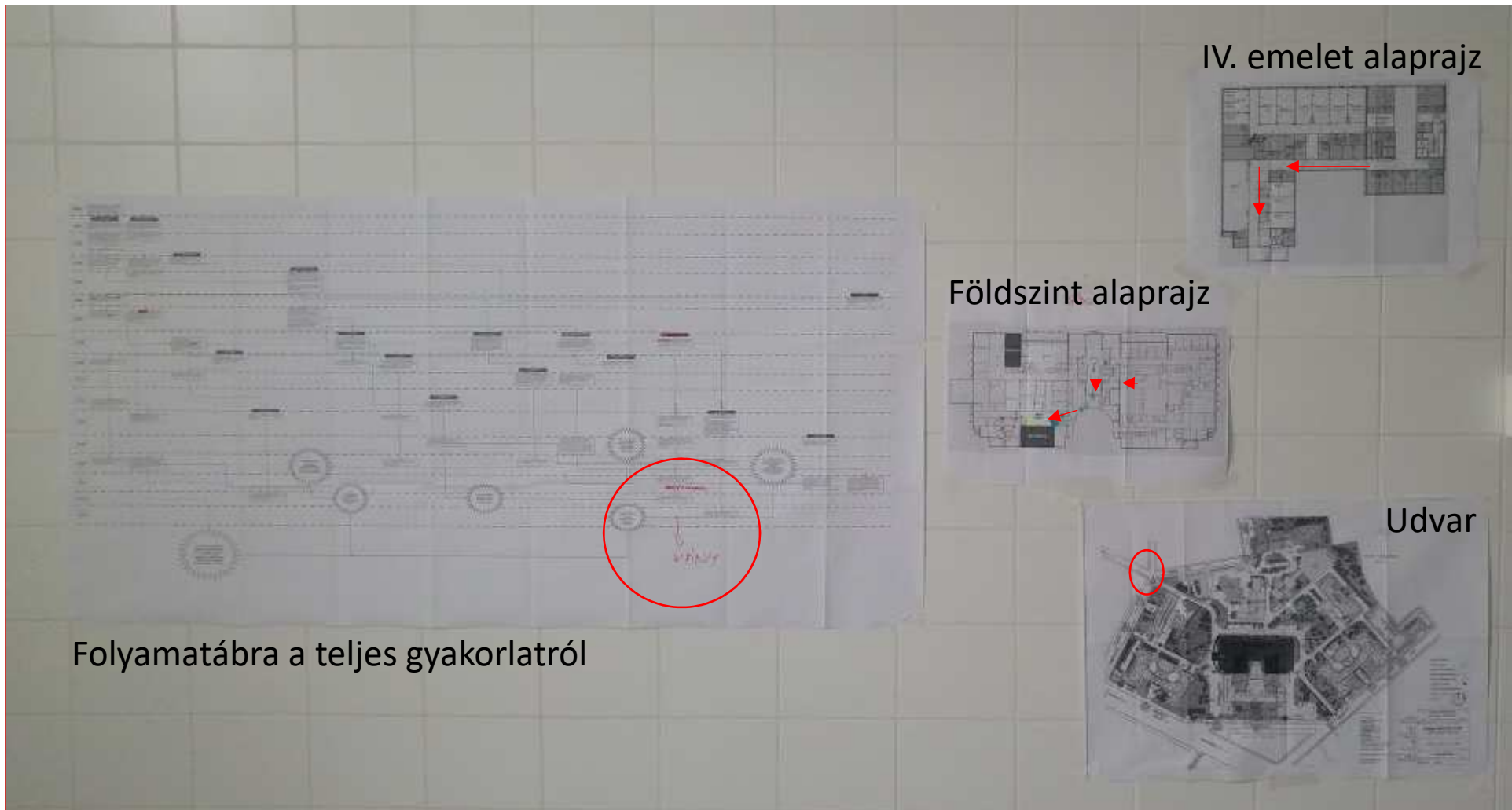
Folyamatábra a teljes gyakorlatról