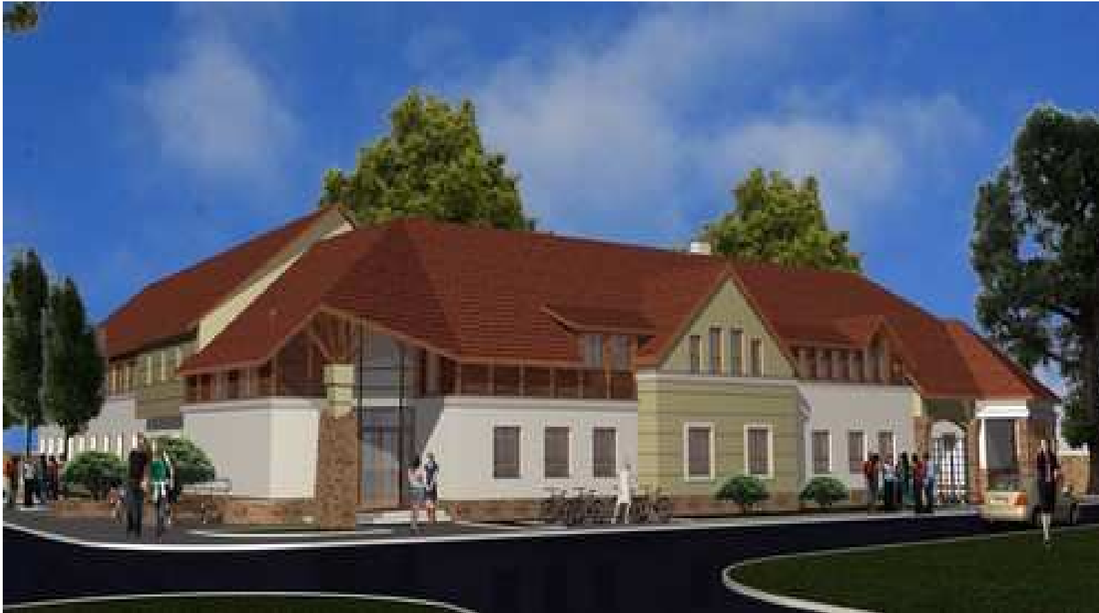
Az Egészségügyi Centrum látványterve 2009. június